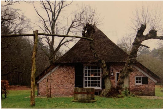
Oud Vels, ook bekend als leemhusie of Kniep'nhusie

Voor onze boerderij stond ooit een oude waterput van zandsteen. Deze put is in de tijd voordat wij er woonden gestolen. Jaren later hebben we de plek met het ondergrondse deel gevonden. Eenzelfde (mogelijk dezelfde, maar dit is nooit uitgezocht...) put stond later voor het kleine boerderijtje Oud Vels alwaar het nadien ook is gestolen. De ronde put bestond uit losse delen en was geliefd historisch erfgoed.