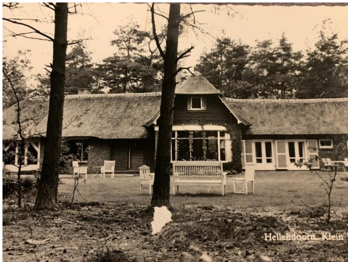
(Klein Eelerberg – ansichtkaart uit 1969)

Ik heb de professor (In 1966 op 79-jarige leeftijd overleden) wel enkele keren gezien, maar eigenlijk nooit gesproken.