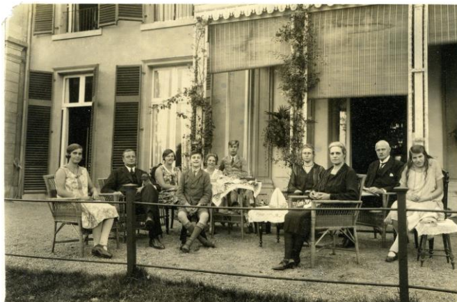
(familie Vening Meinesz rond 1926 bij de villa)

Ik juich het toe dat het landgoed zoveel mogelijk in zijn oorspronkelijke staat wordt behouden en ik weet zeker dat ook de professor het niet anders zou hebben gewenst.